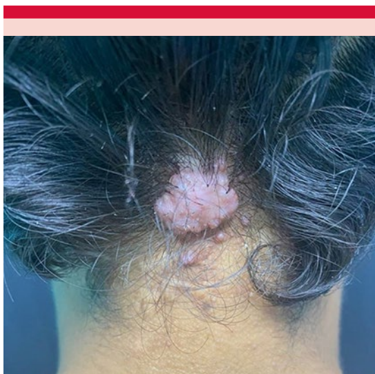
Figura 1. Panorámica: tumoración de bordes regulares bien definidos, de aspecto queiloideo.

El resto del examen físico sin alteraciones. La tricoscopia con luz polarizada mostró escamas