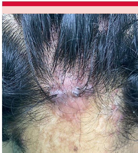
Figura 4. Aspecto de la lesión posterior al tratamiento.

vía oral una vez al día durante 10 semanas, corticosteroide sintético de alta potencia intralesional (acetónido de triamcinolona 12 mg en intervalos de 4 semanas) previas sesiones de crioterapia con alivio evidente de la lesión a 6 meses de tratamiento; se planificó intervención quirúrgica. Figura 4