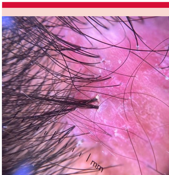
Figura 2. Tricoscopia de luz polarizada con escamas blanquecinas, halo blanco perifolicular sobre base eritematosa y pelos en penacho.

Se indicó tratamiento antibiótico tópico con mupirocina cada 8 horas durante 10 días, antibiótico sistémico con doxiciclina 100 mg