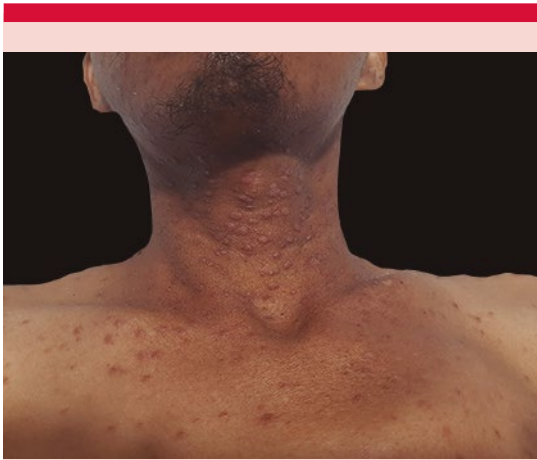
Figura 1. Neoformaciones de aspecto papular, del color de la piel, hiperpigmentadas y eritematosas, de 1 a 3 mm de diámetro, algunas umbilicadas en parte anterior del cuello y el tronco.

compatible con hepatoesplenomegalia. No se determinó la carga viral ni el conteo de CD4. La tomografía axial computada de tórax, tomada el 11 de octubre de 2022, evidenció derrame pleural bilateral y zona de consolidación basal en el hemitórax derecho.