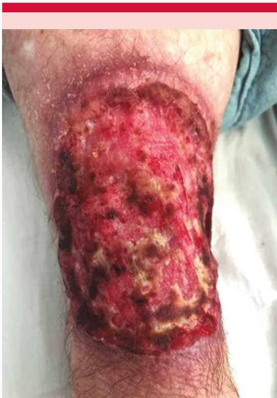
Figura 1. Dermatitis que afecta la cara anterior del antebrazo derecho, localizada y asimétrica, constituida por una neoformación ulcerada de aproximadamente 10 x 8 cm, de bordes bien definidos y superficie con zonas necróticas y hemorrágicas, de evolución crónica.

simple de tórax evidenció un proceso neumónico y hallazgos que sugirieron conglomerado ganglionar axilar derecho probablemente abscedado, sin descartar extensión de un proceso neoformativo.