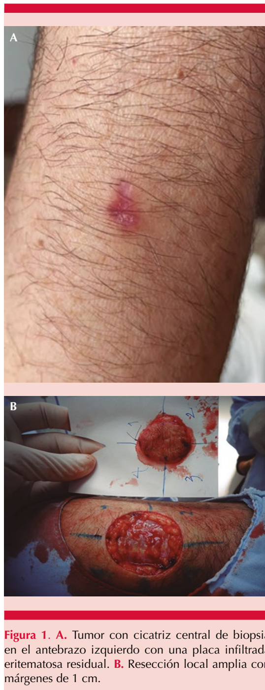
Figura 1. A. Tumor con cicatriz central de biopsia en el antebrazo izquierdo con una placa infiltrada eritematosa residual. B. Resección local amplia con márgenes de 1 cm.

La inmunohistoquímica fue positiva para CK (AE1/AE3), CK5/6, CK7, CK19, CK17, CK14, EMA, ACE policlonal, CA 19.9, S100 y Ki67 con índice de proliferación celular del 20% ( Figura 3 ). Con los hallazgos anteriores se consideró