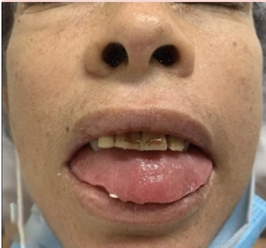
Figura 2. Acercamiento de la macroglosia; se observa la indentación de los bordes de la lengua.

En el abdomen se observaron múltiples pápulas subcutáneas redondeadas, de bordes definidos, regulares, sin cambio epidérmico asociado, con tamaños variables entre 5 y 10 mm. Figura 3