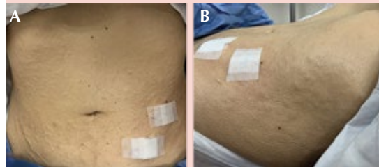
Figura 3. Pápulas subcutáneas en el abdomen. A. Cara anterior. B. Vista lateral.

Con estos hallazgos se confirmó el diagnóstico de amiloidosis sistémica y se ampliaron los estudios en búsqueda de la causa subyacente, encontrando en la electroforesis de proteínas hipoalbuminemia, IgG kappa y proteína de