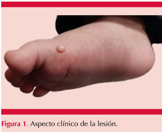
Figura 1. Aspecto clínico de la lesión.

El objetivo de este caso clínico es analizar la manifestación inusual de esta tumoración en un paciente pediátrico; hasta el día de hoy se han reportado únicamente tres casos clínicos con esta topografía; los casos previamente reportados se muestran mayormente en la cabeza, el cuello y el tronco, con predominio de la línea media. Posterior al estudio clínico, histológico e inmunohistoquímico se recomienda buscar