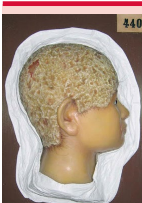
Figura 3. Tiña fávica. Moldeado de cera procedente del Hospital de San Juan de Dios. Museo Olavide, España.

La piel habla y nosotros la escuchamos por medio de las lesiones elementales, cada enfermedad desencadena una clínica diferente y los dermatólogos nos volvemos los detectives. Hay múltiples enfermedades y probablemente muchos diagnósticos serán los mismos que se dieron en el pasado, enfermedades antiguas, pero debe tomarse en cuenta que estas enfermedades se han modificado y quizá cambien