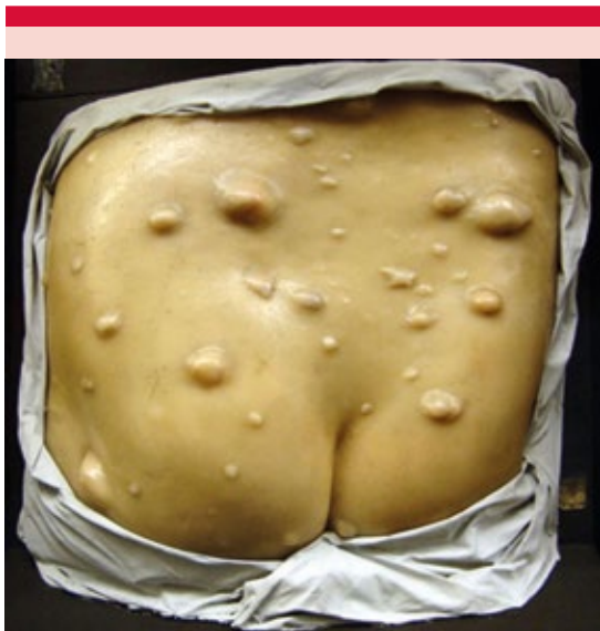
Figura 2. Neurofibromatosis múltiple. V Tramond. Museo de la Escuela de Medicina, México.

Debemos tener en cuenta que, en los últimos 100 años, las enfermedades de la piel han aumentado en cantidad y morfología. Las lesiones cutáneas son estructuras tridimensionales con ángulos específicos y, a pesar de la fotografía y las nuevas tecnologías, ninguna de éstas logra representar de manera precisa y real las lesiones dermatológicas. Incluso en la actualidad hay autores que niegan el hecho de que el arte del moulage y el mouleur desaparecieran y presumen de artistas que continúan realizando estas técnicas de moldeado en cera. 8