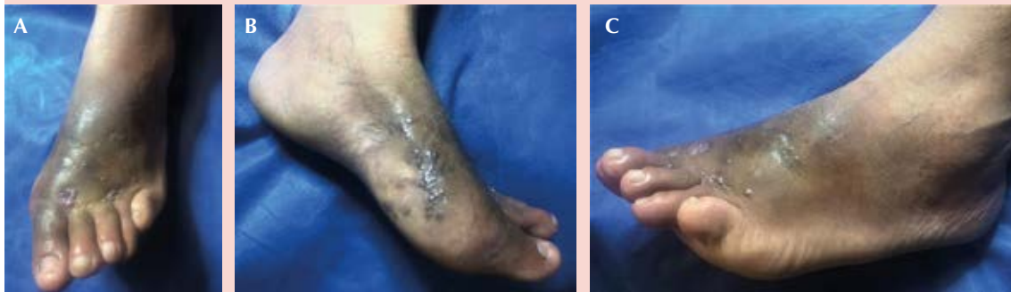
Figura 1. Actinomicetoma vista panorámica (A) y vista lateral (B y C).