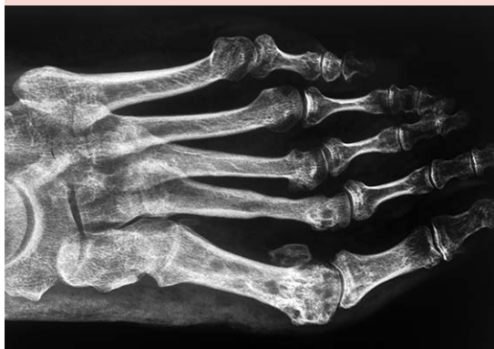
Figura 2. Radiografía en proyecciones anteroposterior, en la que se observa actividad osteofílica de actinomicetoma con formación de geodos.

en el estado de Guanajuato (Lavalle, 1966), uno en Sonora, uno en Jalisco, uno en Puebla y otro de Chihuahua. 8 En 2014, Bonifaz y colaboradores 4 reportaron 3 casos más. Afecta con mayor frecuencia a hombres (relación hombre a mujer de 3 a 1), lo que se cree puede estar relacionado con factores ocupacionales y hormonales. Suele ocurrir entre la tercera y cuarta décadas de vida, rara vez afecta a menores de 15 años (4.5%). 3,4,9