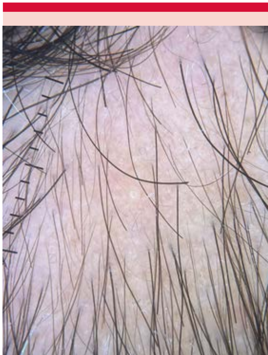
Figura 3. Tricoscopia del caso 2: se observan vellos, pelos blancos y anisotricosis. Ausencia de puntos negros y amarillos.

La alopecia temporal triangular, también llamada nevus de Brauer, fue descrita por primera vez por Sabouraud en 1905 y recibe el nombre por su localización típica en el área frontotemporal y por tener una forma triangular en la mayoría de los casos. Es una condición benigna que causa una alopecia que no progresa en el tiempo. Existen pocos reportes de caso de este tipo de