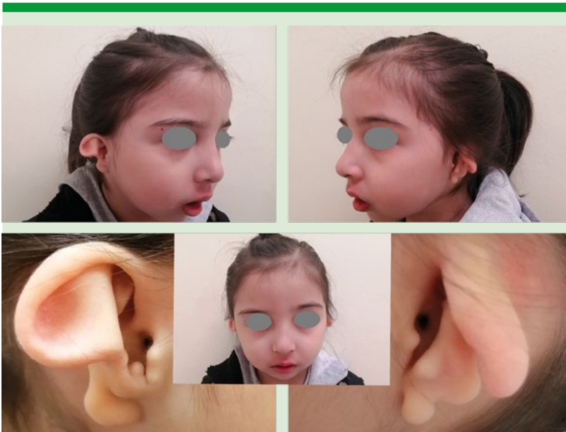
Figura 1. Características clínicas principales de la paciente. Se observan las mejillas abultadas, microstomía, microrretrognatia, implantación baja de las orejas y el aspecto típico en signo de interrogación.

El coeficiente intelectual de ejecución resultó en 76 (WPPSI III). Audiometría lúdica con curva de perfil ascendente de hipoacusia superficial de tipo conductivo en oído derecho. Oído izquierdo con curva de audición normal. Logoaudiometría del oído derecho con umbral de máxima discriminación fonémica del 100% a 50 dB patrón