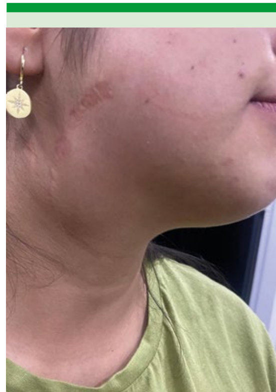
Figura 1. Herida quirúrgica previa con bordes afrontados y cicatrización hipertrófica; tumoración de aspecto blando y quístico a la palpación en el hemicuello derecho, de aproximadamente 4 x 4 cm.

Después de dos meses de la intervención quirúrgica, la paciente inició con crecimiento lentamente progresivo en el sitio previo de la tumoración sin más síntomas y después de dos años posprocedimiento y fracaso del tratamiento en su abordaje anterior por su médico tratante se refirió a nuestro servicio con los hallazgos descritos. Al interrogatorio directo la paciente negó disfagia, disnea, dolor o disfonía. Herida quirúrgica previa con bordes afrontados y cicatrización hipertrófica, palpando una tumoración de aspecto blando y quístico en el hemicuello derecho de aproximadamente 4 x 4 cm. Figura 1