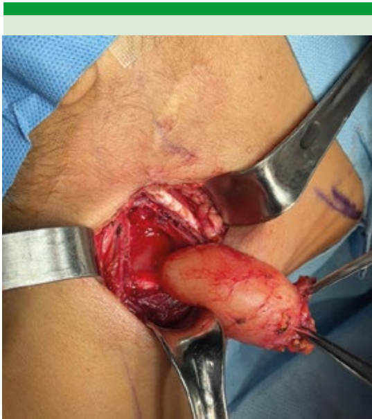
Figura 4. Abordaje quirúrgico transcervical que no afecta la pared faríngea, el nervio laríngeo superior ni el hipogloso.

que contiene ambas partes. El laringocele puede contener moco debido a la presencia de glándulas mucinosas en el ventrículo. La obstrucción de la luz del laringocele puede conducir a la formación de laringomucocele y la consiguiente infección a la formación de laringopiocele, que al no ser tratado y detectado de forma oportuna puede complicarse. 5