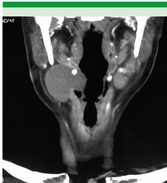
Figura 3. Tomografía simple, coronal a nivel de la glotis que muestra una lesión quística, homogénea, de 4 x 4 cm, bordes bien delimitados y aparente origen ventricular derecho, compatible con laringocele externo.

El reporte histopatológico definitivo fue quiste sacular (laringocele externo). Actualmente la paciente se encuentra a 6 meses de operada con adecuada evolución, asintomática y sin recidiva.