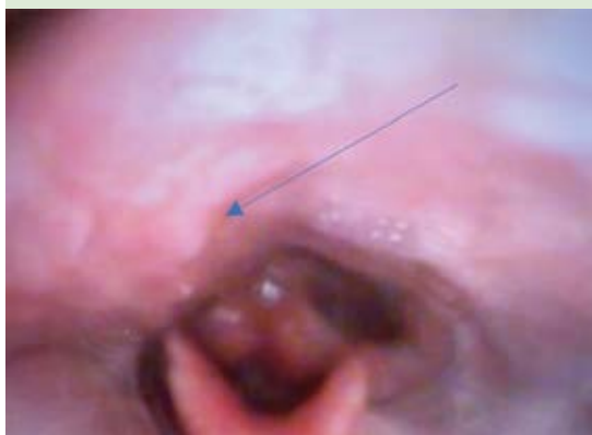
Figura 3. Nasofibrolaringoscopia de hipofaringe en la que se observa ligero abombamiento de la pared faríngea posterior derecha con pulsaciones marcadas (flecha).

terna hacia el espacio faringomucoso y su alta posibilidad de lesión, se estableció relación riesgo-beneficio, decidiendo continuar con vigilancia periódica.